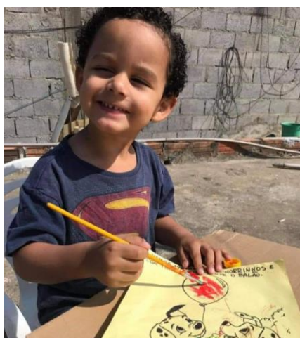
Corona: thuis aan het schoolwerk!

Brazilië is na de Verenigde Staten het land met de meeste doden als gevolg van het coronavirus. President Bolsonaro is algemeen bekritiseerd voor zijn gebrekkige reactie op de epidemie. De uitbraak in Brazilië begon in de rijkere buurten, waarvan de bewoners het virus uit Europa meebrachten. Het virus verspreidt zich nu echter vooral in de armere, dichtbevolkte buitenwijken en de favela's. Daar is afstand houden en handen wassen lastig en kunnen veel mensen niet thuis werken.