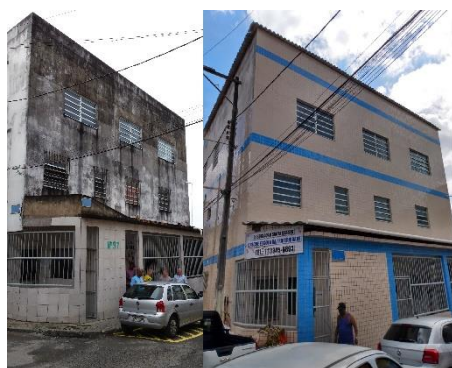
Escola da Fraternidade begin dit jaar en nu!

Begin 2019 hebben wij een projectaanvraag gedaan bij een stil fonds, een particulier liefdadigheidsfonds dat anoniem wil blijven. Dat is gelukt!